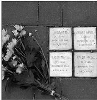
Straße der Erinnerung, Volkertplatz, Wien 2

Im Zweiten Wiener Gemeindebezirk waren vor 1938 40 % der Bevölkerung Juden und Jüdinnen. Fast alle sind von den Nazis vertrieben, und viele ermordet worden. Fast jedeR zweite BewohnerIn des Bezirkes ist in dieser Zeit „verschwunden“. Circa 5.000 jüdische Bürgerinnen und Bürger lebten alleine im Volkertviertel. 1.585 Männer, Frauen und Kinder wurden aus dem Viertel deportiert und ermordet. Der älteste war zur Zeit seiner Deportation 92 Jahre alt, das jüngste Kind 3 Monate. Lange hat es gedauert bis diesen Opfern im Volkertviertels ein Denkmal errichtet wurde.